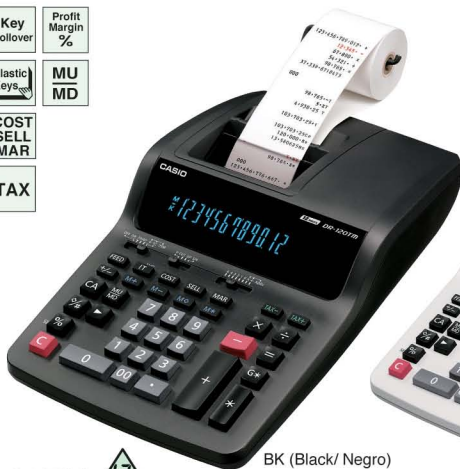
BK (Black/ Negro)