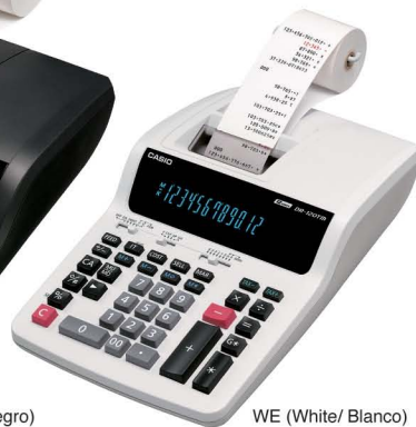
WE (White/ Blanco)